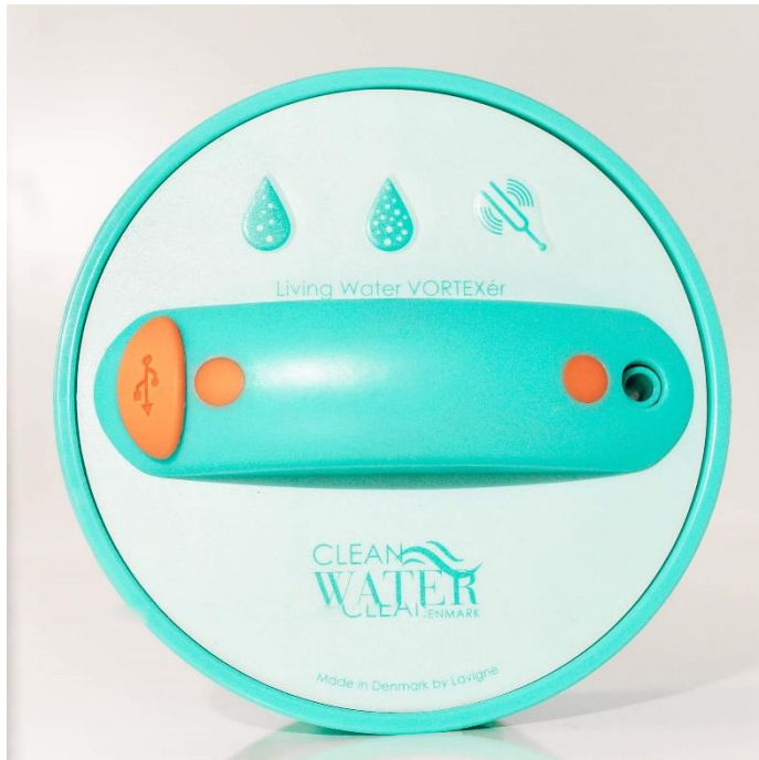
Deckel mit Motor