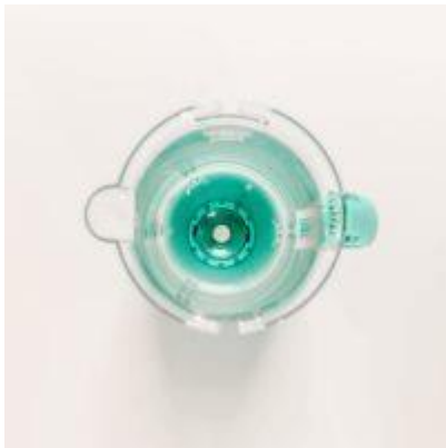
Boden des Krugs mit Silber-Knopf

Ein kleiner versilberte Propeller, der einem Ahornsamen nachgebildet ist, erzeugt einen echten Schauberger-Wirbel und macht aus unstrukturiertem Wasser lebendiges Clusterwasser mit viel Sauerstoff. Der Krug aus bruchfestem Bio-Copolyester für Lebensmittel fasst 1,8 Liter, eine ideale Menge für die tägliche Trinkwasserzubereitung. Zur Reinigung von Kalkrückständen genügt etwas Essig.