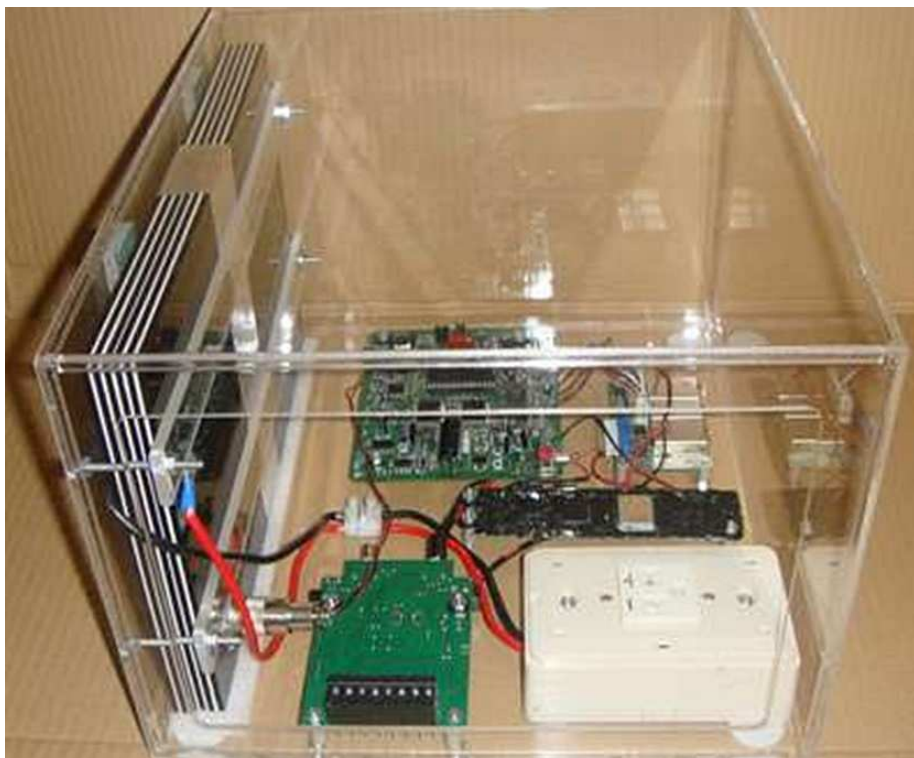
Eine Weiterentwicklung des Fluxgenerators. Solche Module können bis Kraftwerksgröße zusammen geschaltet werden.